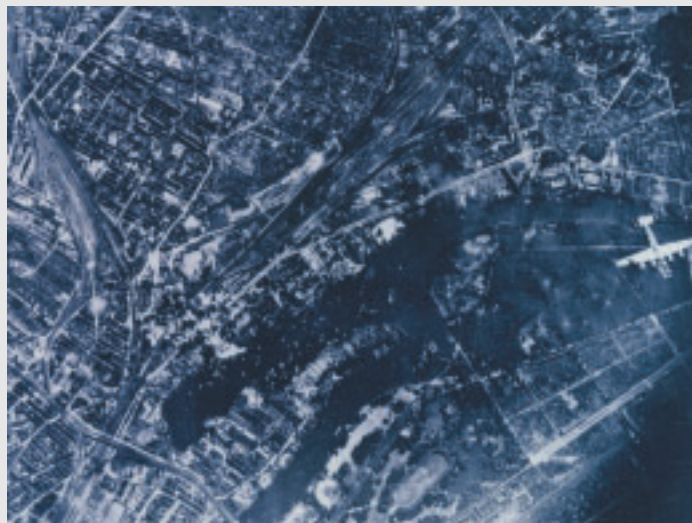
Foto eines Bombenabwurfs über Berlin, Rummelsburger Bucht.

Die tatsächliche aus Kampfmitteln resultierende Gefahr gelangt kaum noch an die Öffentlichkeit. Hieran sind die Branche sowie die verschiedenen staatlichen Stellen nicht unschuldig. Wurde in der Vergangenheit die Gefährdung doch nicht deutlich genug herausgestellt. Das hat nunmehr eine Unkenntnis breiter Bevölkerungsschichten und auch